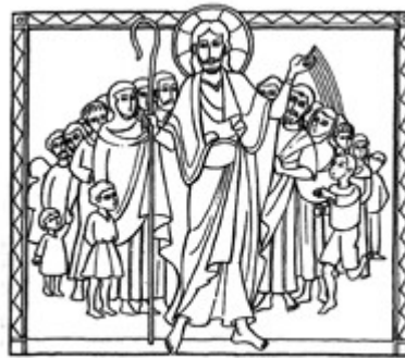
«Io sono il buon pastore» Giovanni 10,11

In quel tempo, Gesù disse: «Io sono il buon pastore. Il buon pastore dà la propria vita per le pecore. Il mercenario – che non è pastore e al quale le pecore non appartengono – vede venire il lupo, abbandona le pecore e fugge, e il lupo le rapisce e le disperde; perché è un mercenario e non gli importa delle pecore.